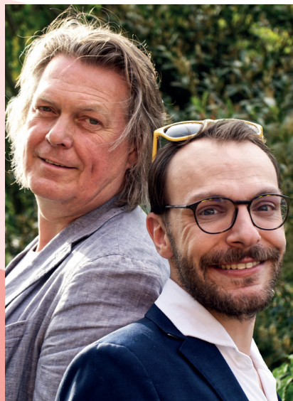
The Boogie Shakers.