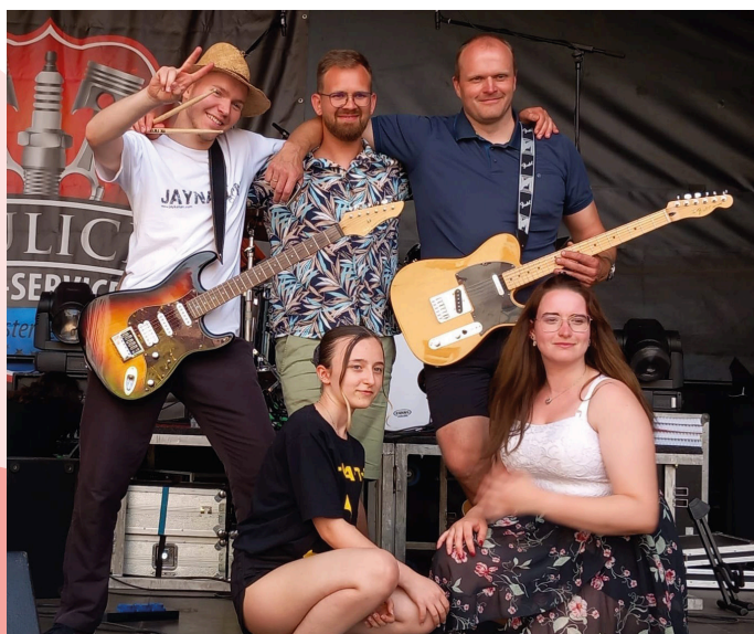
von Boras & Friends.

Förderverein Europa Begegnungen e.V. | Schlosstr. 19